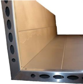
Yhdistä elementit kulmaksi (L-malli)

Kiinnitä palosuojan jalat paikoilleen siten, että lattian kiinnityspalat (E) jäävät jalan ja seinän väliin. Asenna seinäkiinnikkeet kansilistan väliin kuvan mukaisesti.